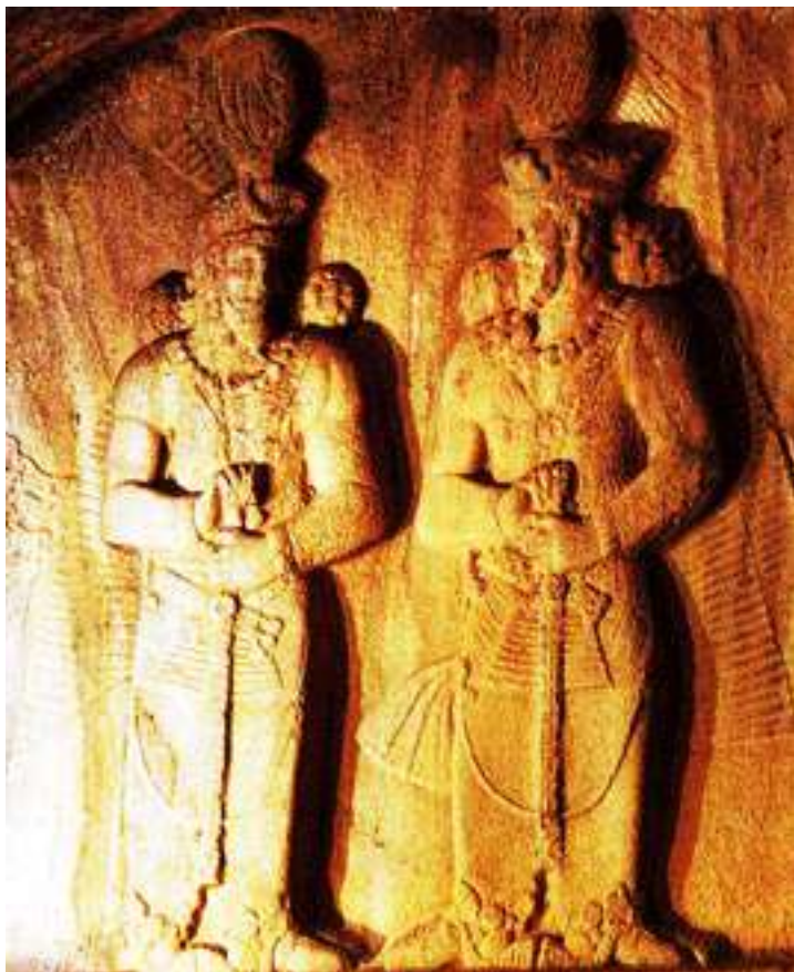
نقش شاپور دوم و شاپور سوم در نزدیکی کرمانشاه

ایلچیگری، از طرف امپراتور روم به ایران فرستاده می شد. این شخص، علاوه بر مقام روحانی، طبیب هم بود و یزدگرد را از مرضی شفا داد و او را فوق العاده از خود ممنون ساخت.