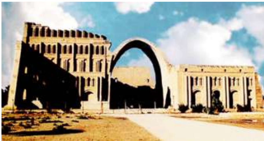
طاق کسری در مدائن

اسقف مذکور مطابق این دستور با شش نفر رفیق خود عازم سفر ترکستان شد. غذای روزانه‌ی این هفت نفر شامل هفت گرده‌ی نان و یک کوزه‌ی آب بود. این هفت نفر نوشتن را به ترک‌ها آموختند و بسیاری از آنان را تعمید دادند. یک اسقف ارمنی هم به آنان ملحق شد و به ترک‌ها کاشتن گندم و اقسام سبزی‌ها را تعلیم داد. این هفت نفر، هفت سال در ترکستان توقف نموده، بعد به ایران برگشتند. ایلچی امپراتور روم که به ترکستان فرستاده شده بود، با چشمان خود نتیجه‌ی زحمات مبشرین را دیده، تعجب نمود که خدا به وسیله‌ی خدام خود کارهای عجیبی به انجام رسانیده است.